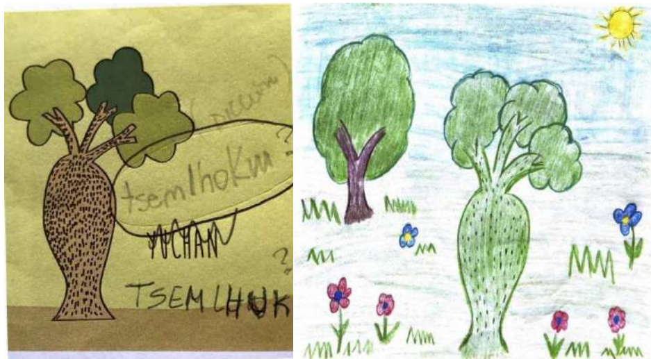
Ilustración nativa de un palo borracho o suchán (tsemihuk) y su correspondiente vectorización digital y nombre en forma de palabra escrita durante el proceso de revisión editorial.